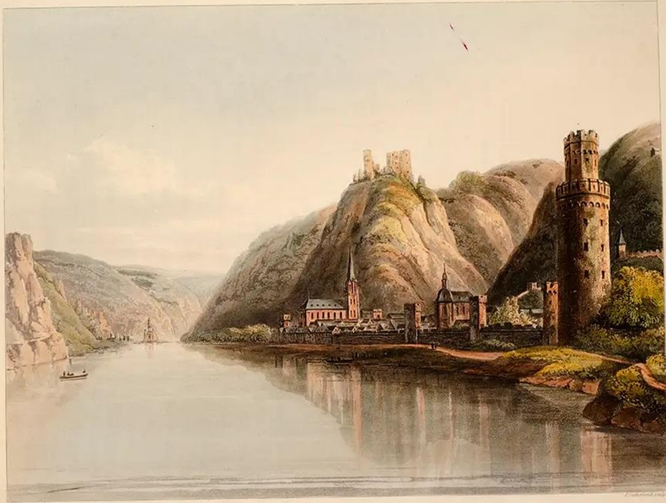
THE TOWN OF OBERWESSEL.